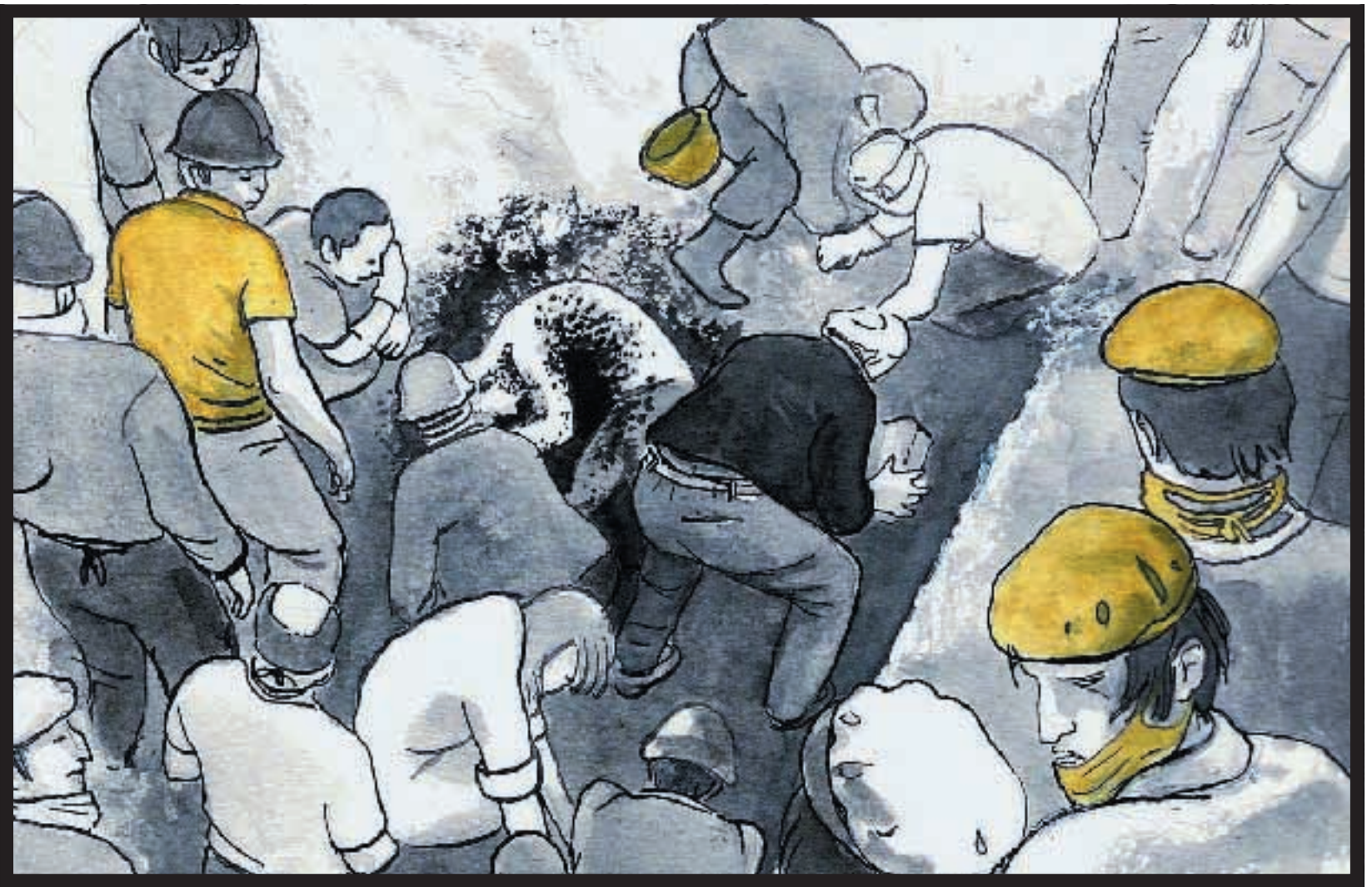
SOCCORSI Al lavoro tra le macerie