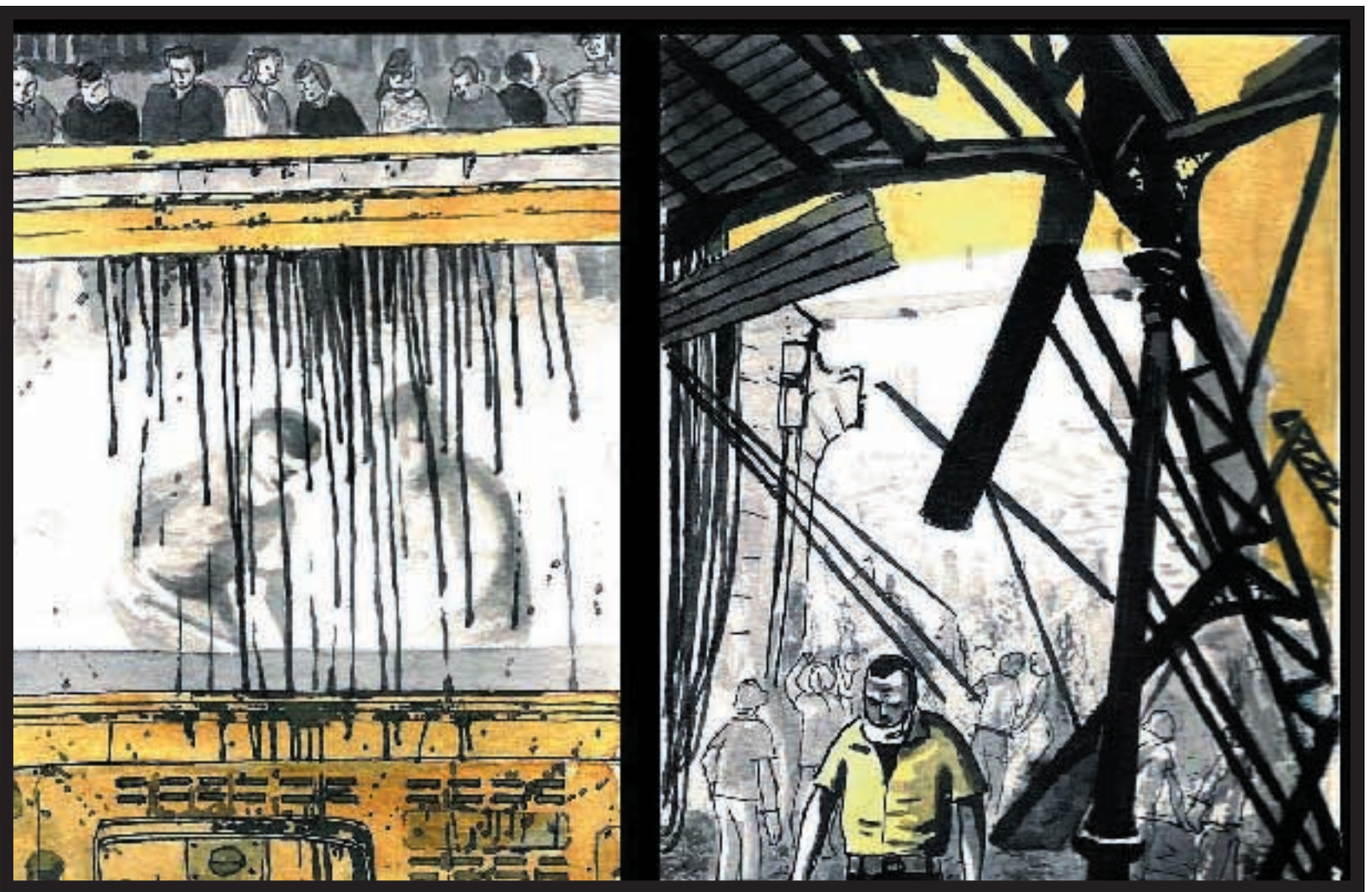
SANGUE La stazione a pezzi