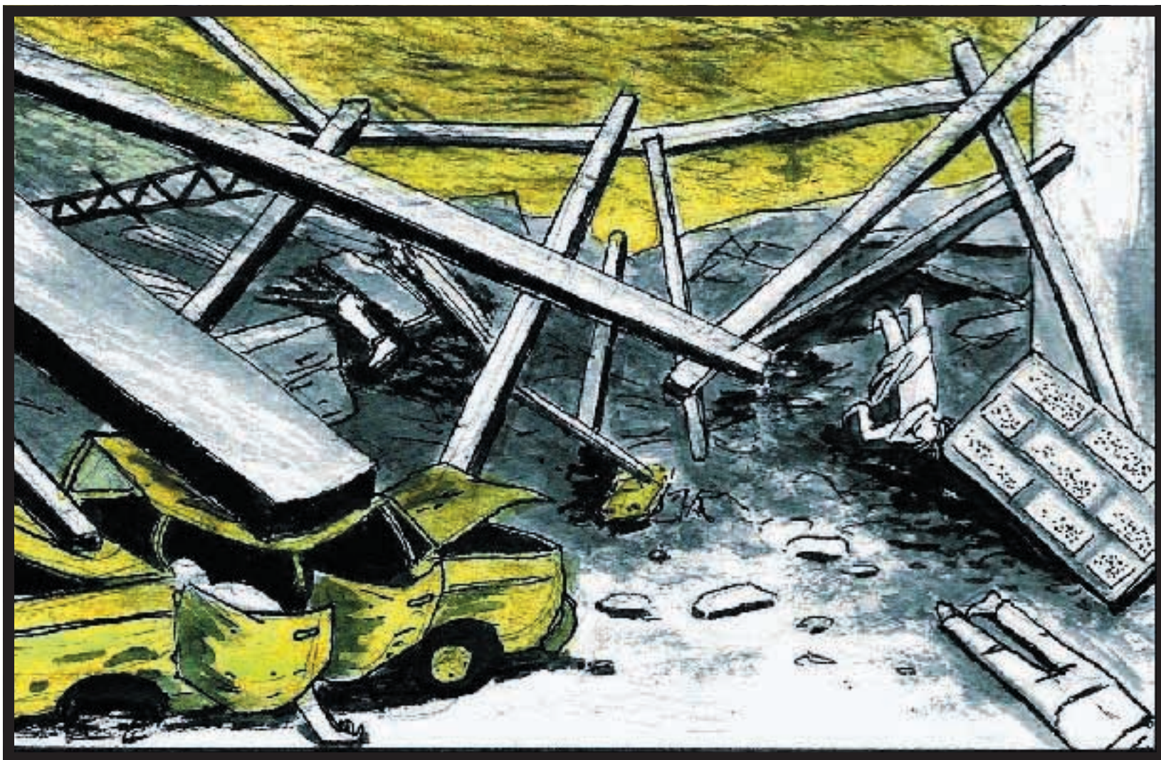
DISTRUZIONE Auto e corpi

ideatrice della strage. Ciò ha un po' il sapore di reminiscenze cinematografiche, lontane dall'immaginario a cui lo scrittore ci ha abituati. Invece la zampata di Macchiavelli torna dolorosa nelle descrizioni ferocemente critiche di Bologna, città che conosce e ama come pochi, tanto da saperne denunciare spietatamente i difetti. Oppure nelle riflessioni, con puntuale riscontro nella realtà, sull'inquinamento della foce del Po.